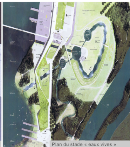
Plan du stade « eaux vives »